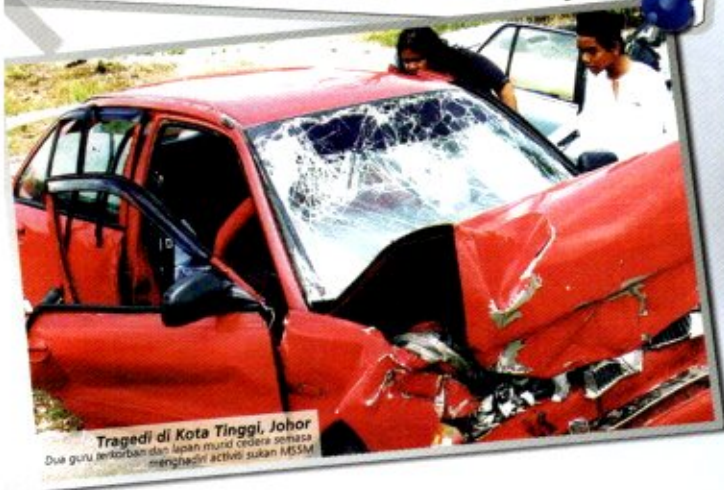
Tragedi di Kota Tinggi, Johor Dua guru terkorban dan lapuk mundu cedera semasa menghadiri aktiviti sukan MSSM